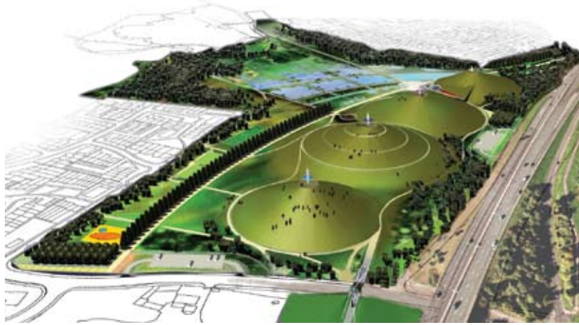
ÜÇ BOYUTLU ÇİZİM